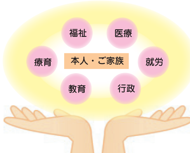
和歌山県発達障害者支援センター ポラリス

ポラリス は、全てのライフステージで一貫した支援ネットワークを構築するために、社会福祉法人愛徳園が和歌山県の委託を受けて設置した機関です。